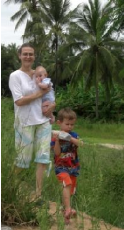
Steen voor in de rivier