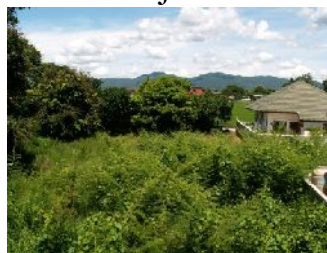
Uitzicht van onze gastenkamer!

bomen, en de bergen op de achtergrond, maar 10 minuten rijden met de auto! En toch zitten we ook maar 10 minuten van het centrum van Lampang met zijn doolhof van markten en winkeltjes, met tussendoor beroemde tempels aan beide zijden van de rivier die door het hart van de stad loopt. Bijna 4 weken geleden lieten we de taalschool, onze