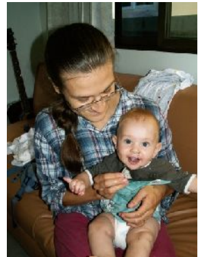
Emmet eet drakenvrucht