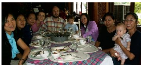
Afscheid van onze leraressen in Lopburi