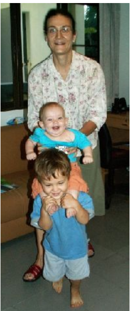
Op de schouders