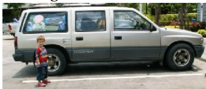
Onze volgeladen auto met fanclub

medestudenten en vrienden in Lopburi achter ons en kwamen we aan in Lampang met onze auto tot het dak volgeladen, na een rit van 7 uur. Na heel wat shoppen is ons huis nu ingericht en