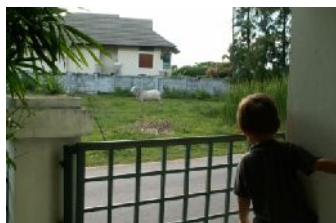
De koeien op het veldje

Terwijl we thuis aan ons bureau zitten, kijken we uit op een veldje aan de andere kant van de weg waar koeien grazen. Achter de muur eromheen zijn de boeren hun rijstvelden aan het bijhouden – we kunnen ze zien als we 10 meter naar rechts lopen. Door de ramen aan de achterkant zien we een zee van groene bosjes en